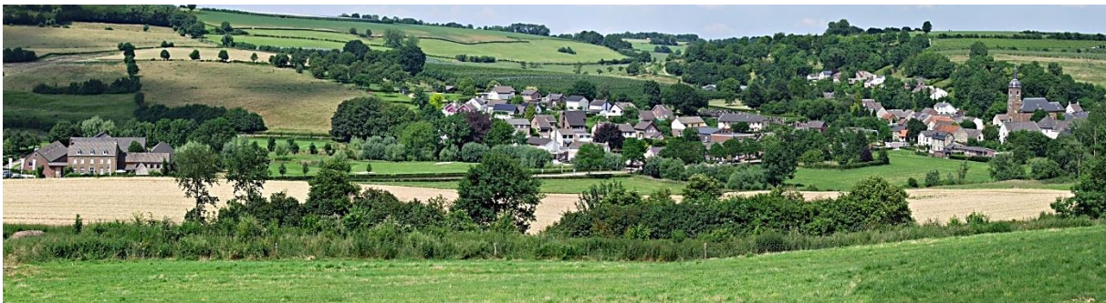
Uitzicht op Eys, met links de Eyserhof

U moet zelf zorgen voor een reis- of annuleringsverzekering, omdat wij bij annulering reeds gemaakte kosten altijd aan u zullen doorberekenen.