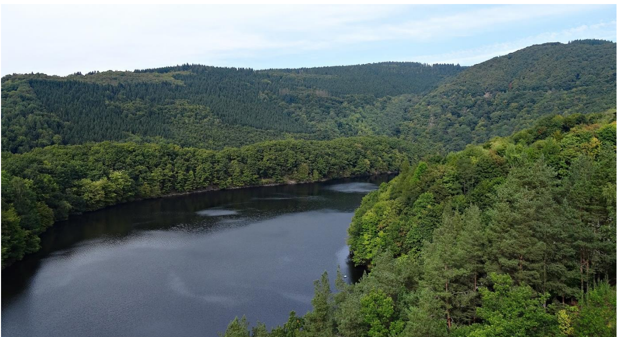
Langs de Urftsee gaan we verder om via een stuwdam bij Rurberg te komen.